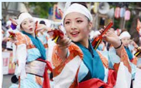
元気いっぱい！よさこい演舞！