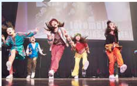
かっこいい！キッズダンス！