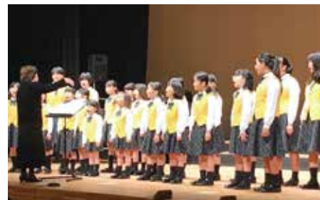
大迫力の子ども合唱団！